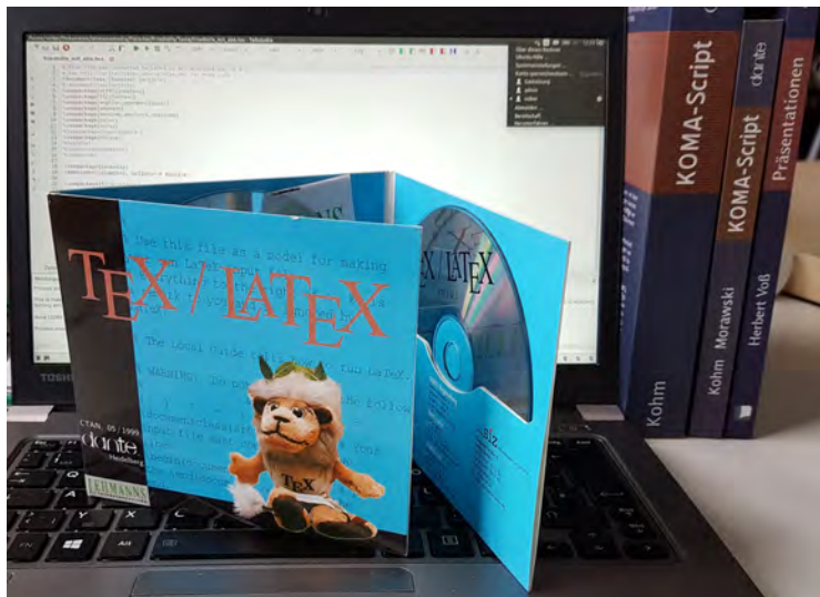
1999: Erstes gemeinsames Produkt